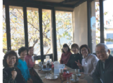
食後のコーヒー おいしかったあ〜