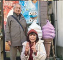
ソフトクリームとふたり… 絵になりますね〜

今回は「神奈川県の名所紹介」というテーマで、鎌倉・小町通り周辺に総務部が出かけました。当日は好天に恵まれ、暖かい日差しの中を「いざ、鎌倉へ!!」。一同7名で、小町通りから若宮大路へそぞろ歩きをしました。