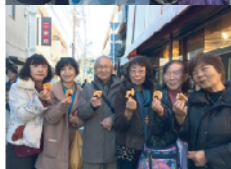
食べちゃいますね〜 焼きたてせんべい