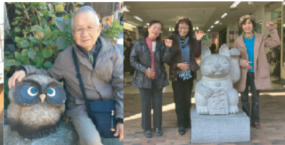
門松さんは縁起の 良い“不苦勞”と “まねねこまねくまね” 早口言葉で〜す