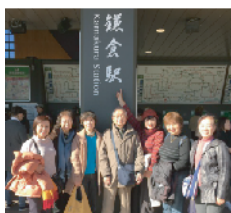
散策日和の秋晴れ いざ出発！