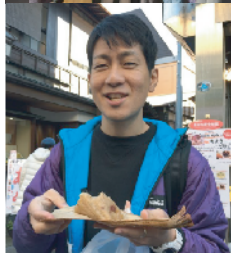
ちまきお兄さん 「いかがですかあ〜」