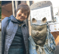
佐野部長はタヌキと ツーショット