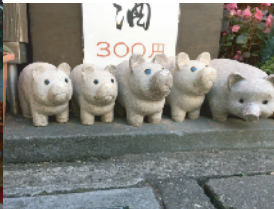
愛らしいぶうちゃん兄弟