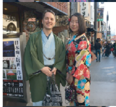
着物姿のカップル おや、彼は外人さん