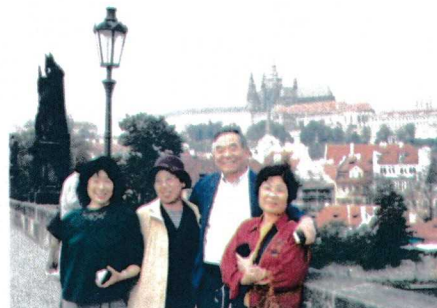
チェコ プラハにて