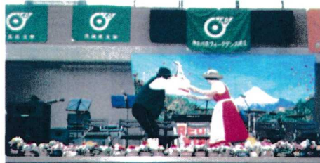
2006年関甲連ジャンボリーin箱根 ハイジとおじいさん