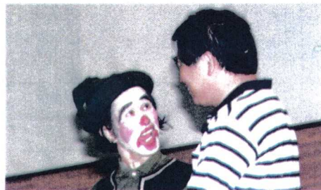
この少年はだ〜れだ？ ↑