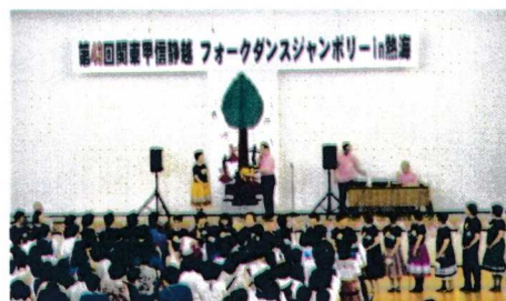
2017年5月関甲連ジャンボリーin熱海