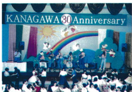
県連30周年1997年5月 箱根小涌園