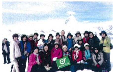
2012年イタリア訪問の旅