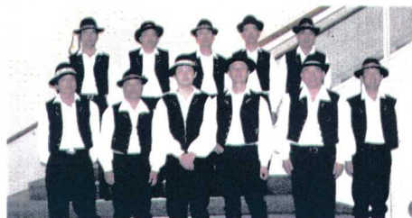
2007年12月22日わくわくFDフェスティバル 茅ヶ崎市民文化会館